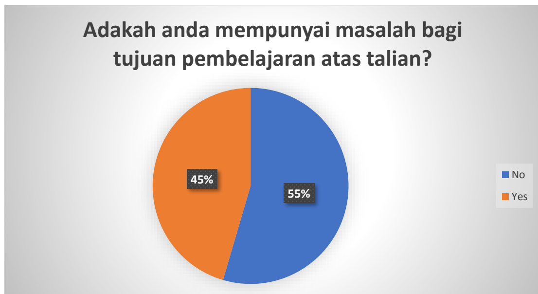
Statistik 1: Borang Maklumbalas PKP fasa 3

Dengan pengumuman ini, para pelajar tidak dapat pulang ke kampus dan ini sekaligus tidak dapat membantu para pelajar yang mempunyai masalah internet yang terhad bagi yang berada di rumah untuk tujuan E-Learning pada 27 April 2020. Statistik dibawah menunjukkan terdapat 440 mahasiswa dan mahasiswi daripada 968 yang telah isi borang ini yang mempunyai masalah untuk meneruskan E-Learning pada 27 April 2020.